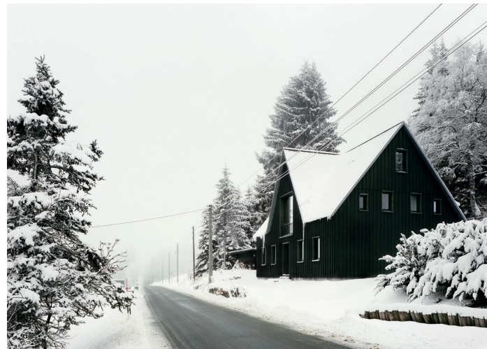
Fertigstellung: 2020 | Bauherr: privat