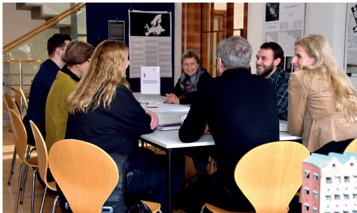
Auch in diesem Jahr diskutieren die Teilnehmenden im Workshop wieder aktuelle Frage- und Problemstellungen aus dem Wettbewerbs- und Vergabewesen.

Der Ausschuss Wettbewerb und Vergabe der Architektenkammer Sachsen lädt zum Workshop in das Haus der Architekten ein. Die Veranstaltungsreihe richtet sich gleichermaßen an wettbewerbs- und verfahrensbetreuende Büros sowie Architekt:innen und Ingenieur:innen. Ebenso angesprochen sind Vertreter:innen auslobender Vergabestellen sowie sonstige Behörden, welche mit der Vergabe von Architekten- und Ingenieurleistungen befasst sind, wie auch Unternehmen und alle weiteren am Vergabeprozess Interessierten.