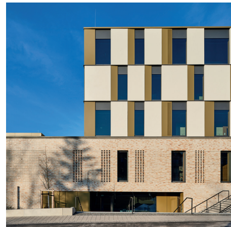
Veranstaltungsort ist die Gemeinschaftsschule Campus Cordis in Dresden. Planung: RBZ Generalplanungsgesellschaft mbH, Storch.Landschaftsarchitektur und May Landschaftsarchitekten, Foto: Robert Gommlich

Der Fokus in diesem Jahr liegt unter anderem auf den Planungsprozessen und den Projektbeteiligten. Und diesmal reden wir nicht nur über Schule, sondern erleben diese auch live – seien Sie mit uns Gast in der erst im Februar offiziell eingeweihten Gemeinschaftsschule Campus Cordis in Dresden. Hier werden wir im Veranstaltungssaal tagen, in der Mensa Mittag essen, in Klassenräumen diskutieren und die Schule von unten nach oben, innen und außen erkunden. Für die unterschiedlichsten Akteure wie Entscheidungsträger:innen in Städten, Gemeinden, Schulämtern und Bildungsagenturen, Architekt:innen und Fachplaner:innen, Pädagog:innen, Erzieher:innen und Lehrer:innen soll die Konferenz eine interdisziplinäre Plattform sein und den lebhaften Austausch untereinander fördern.