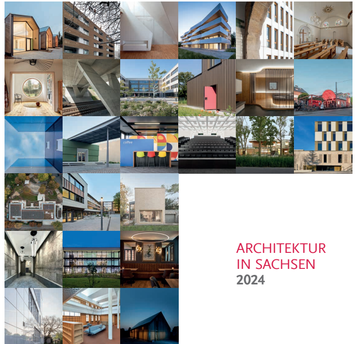
ARCHITEKTUR IN SACHSEN 2024