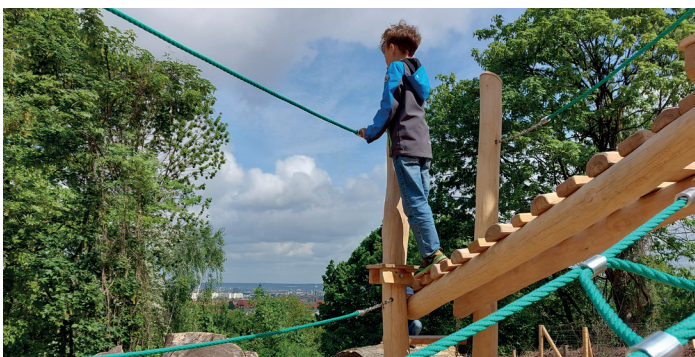
Netzwerk Stadtgrün – ein Beispiel dafür ist der neue Waldspielplatz im Südpark.

Die Impulsvorträge sollen für die Thematik sensibilisieren und einen Eindruck von der Komplexität des Netzwerkes Stadtgrün vermitteln. Beispiele aus der Dresdner Stadtverwaltung geben Input und Anregung, wie die Entwicklung von Stadtgrün im Zusammenhang mit Stadterneuerung und bei einem konkreten Planungsprozess gedacht wird, wer beteiligt ist bzw. wie die Zusammenarbeit innerhalb der Verwaltung, mit beauftragten Planern, aber auch hinsichtlich der Bürgerbeteiligung laufen sollte, welche Schnittstellen und Konflikte es gibt. Beispiele aus Leipzig und Görlitz dienen als Anregung und Inspiration, wie Projektarbeit mit vielen Beteiligten funktionieren kann. Am Beispiel des Großen Gartens von Dresden erfahren Sie, welche Handlungsstrategien es zur Bewältigung des Klimawandels in historischen Gärten gibt und wie man Netzwerke für fachliche und praktische Herausforderungen nutzen und Wissen zusammenführen kann.