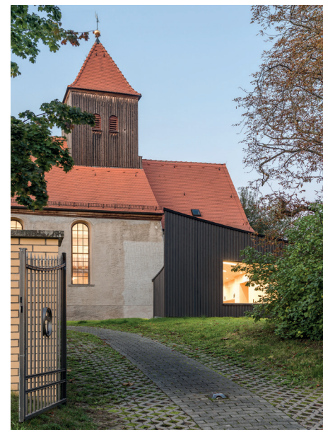
Fertigstellung: 2021 | Bauherr: Kirchgemeinde Holzhausen