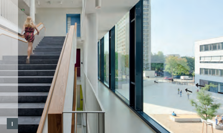
K NEUBAU GYMNASIUM TELEMANN-STRASSE MIT DREIFELDSPORTHALLE, LEIPZIG Realisierungswettbewerb, 2013 Auslober: Stadt Leipzig, vertr. durch Hochbauamt 1. Preis: Alten Architekten, Berlin