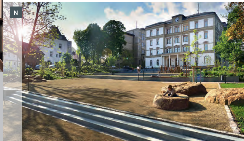
N TECHNIKUMPLATZ MITTWEIDA Realisierungswettbewerb, 2009 Auslober: Stadt Mittweida 1. Preis: ARGE Olaf Sporbert, Freier Architekt, Frankenberg + plandrei Landschaftsarchitektur GmbH, Erfurt